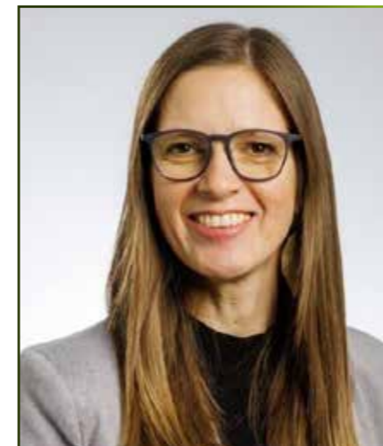
Liebe Bürgerinnen und Bürger von St. Anna am Aigen,

die ersten Monate des Jahres haben uns bereits vor große Herausforderungen gestellt. Besonders der massive Schneeeinbruch am 20. und 21. Februar mit stellenweise bis zu 75 cm Neuschnee hat unsere Feuerwehren, den Räumdienst und viele Bürgerinnen und Bürger stark gefordert. In dieser außergewöhnlichen Situation haben unsere Feuerwehren mit großem Einsatz und hoher Professionalität Herausragendes geleistet. Ebenso gilt mein Dank den Mitarbeitern des Räumdienstes, die über die Wintermonate hinweg dafür gesorgt haben, dass unsere Straßen und Wege bestmöglich passierbar bleiben.