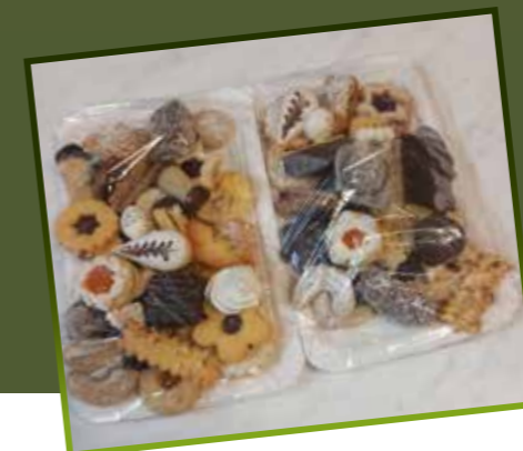
Mehlspeisen zugunsten Steirer helfen Steirer

Wir wünschen dem gesamten Team alles Gute für die kommende Funktionsperiode und viel Erfolg bei ihren vielfältigen Aufgaben.