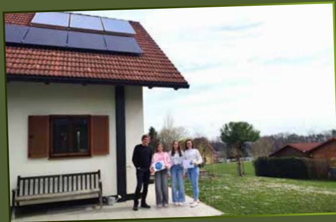
Familie Kreiner mit der PV-Anlage und der thermischen Solaranlage am Hausdach

Und sonst? „In Zeiten von Krisen, Kriegen und steigenden Rohstoffpreisen ist es einfach ein gutes Gefühl, dass man sich selbst versorgen kann“, meint sie. Einen Wunsch hat sie diesbezüglich aber noch: einen Tischherd, der für alle Fälle ein Zimmer wärmt und eine warme Mahlzeit für ihre Familie ermöglicht.