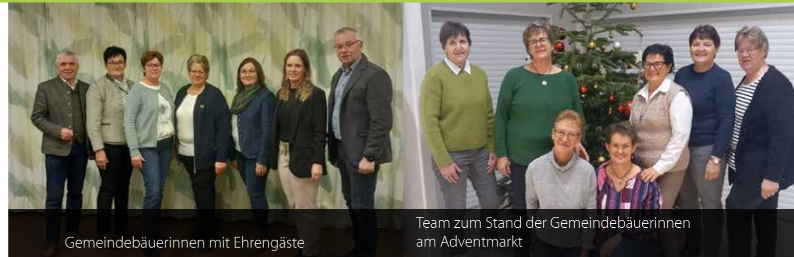
Gemeindebäuerinnen mit Ehrengäste

Die Landjugend St. Anna am Aigen blickt auf ein vielfältiges Programm und ein weiteres aktives Vereinsjahr.